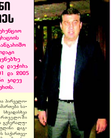
ამის შემდეგ მონვეულმა დელეგატებმა საქართველოს ნაკრების წარმატებაზე და ქართულ კალათბურთში შექმნილ სხვადასხვა გაგრძელება მე-9 გვერდზე

გუმინ სპოხის ექვსიამენის საპრეზიდენტო კანდიდატი საპრეზიდენტო კენჭისყრაში მესამე პაღით აირჩიეს. მისი კენჭისყრა დასრულდა 2009 წლის ნოემბრის 12-ს. მისი კენჭისყრა დასრულდა 2009 წლის ნოემბრის 12-ს. მისი კენჭისყრა დასრულდა 2009 წლის ნოემბრის 12-ს.