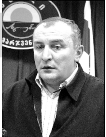
არასამთავრობო სექტორის წარმომადგენლებმა საქმოდ გაგაკრიტიკეს 50%-იანი ბარიერის დაბობის გამო...