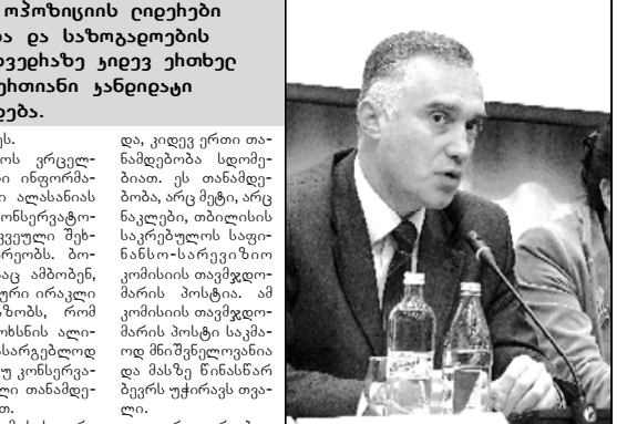
მიძიგური ალანაიას გარიგებას სთავაზობს

მიძიგური ალანაიას გარიგებას სთავაზობს მიძიგური ალანაიას გარიგებას სთავაზობს მიძიგური ალანაიას გარიგებას სთავაზობს