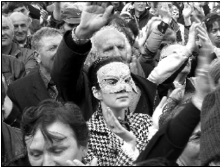
გივი-პრეზიდენტი ჯო ბაილენი ესტუმრა. ოპოზიციამ აპტიცეხდა, სააკაშვილს ბაილენი თვითმფრინავში ჩაიხვას და წაიყვანოს, თუმცა, როგორც სააკაშვილი იტყობა, ნურას უკაცრავად.

იმასაც რა უნდა ექნა, ადგა და რეგიონალურ ლიგაში დაიწყო ასპარეზობა. იმ დღეს როცა ოპოზიცია რუსთაველიდან მტრედებს აფრთხობდა, გადადგების ძახილით, ნოლაიდელმა ბათუმის სანაპიროდან თოღები