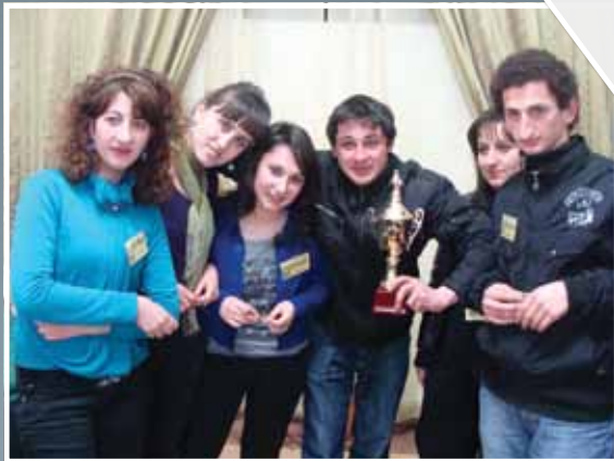
„რა, სად, როდის?“ გამარჯვებულები

მიეცი შესაძლებლობა ყოველ დღეს, იყოს უმშვენიერესი შენს ცხოვრებაში