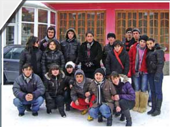
ხიზაბავრელი ახალგაზრდები ბაკურიანში