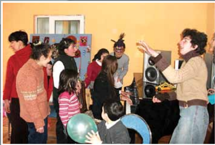
სტუდენტები შეზღუდული შესაძლებლობების მქონე პირთა კავშირის „ია“-ს მოზინადრებთან