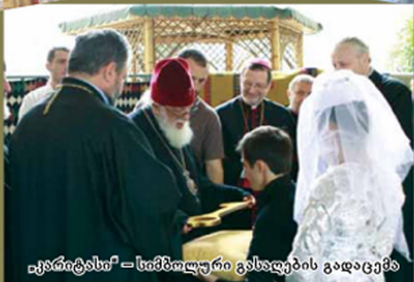
«კარიტასი» – სიმბოლური გასაღების გადაცემა