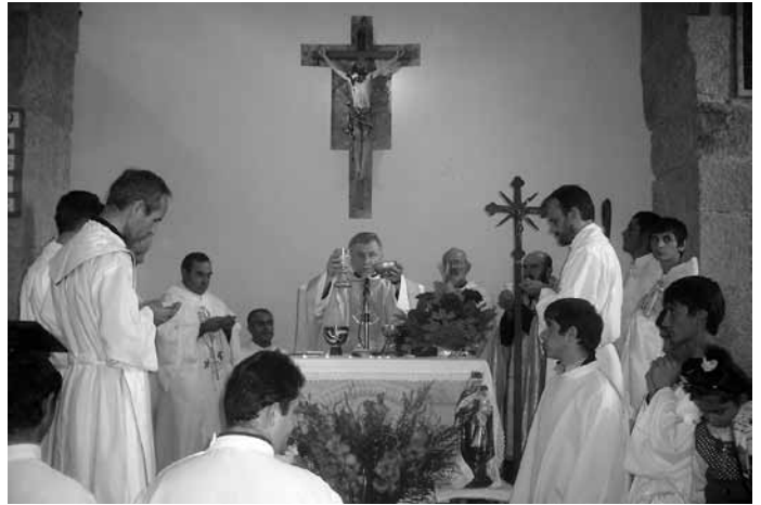
ღვთისმშობლის იდუმალი ციაგი...

შეუძლებელია სიტყვებით გადმოსცე ეს განწყობა, რაც იმ დღეს ვალეში სუფევდა. ფერად-ფერადი ყვავილები, საზეიმოდ მორთული ეკლესია, გაღიმებული და ბედნიერი სახეები, სანთ-