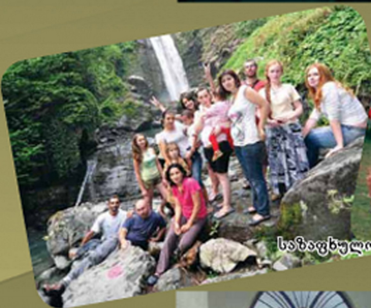
საზაფხულო ბანაკი კახეთში