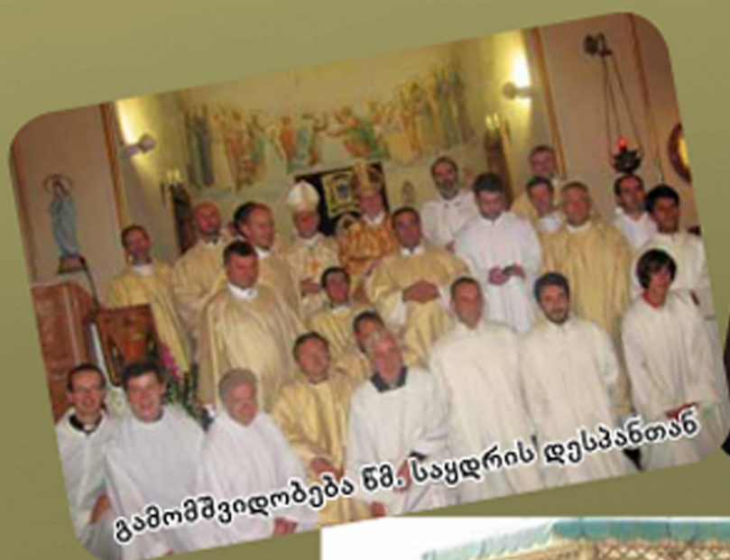
გამომშვიდობება წმ. საყდრის დესპანთან