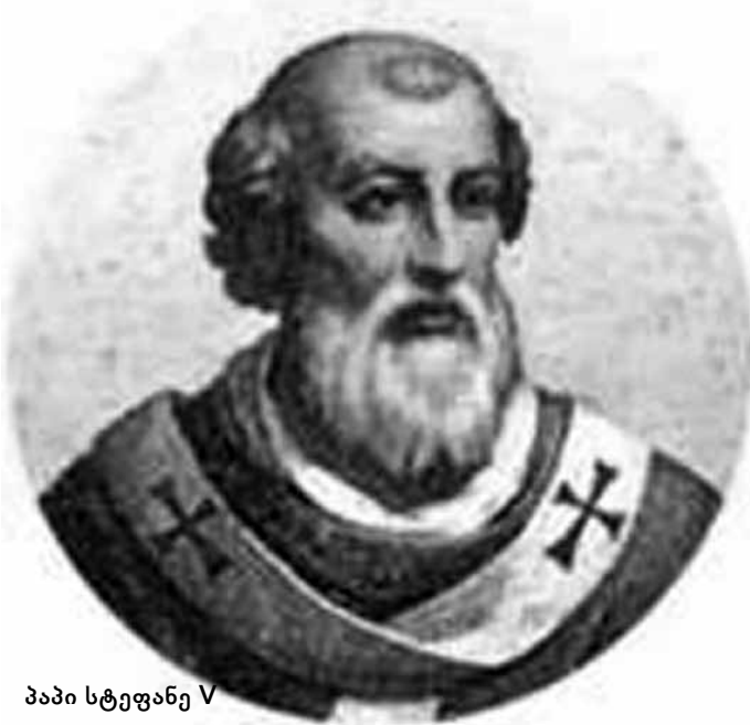
პაპი სტეფანე V