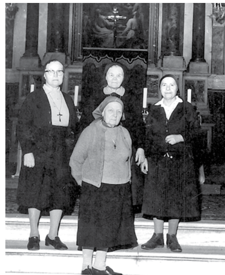
წმ. პეტრე და პავლე მოციქულთა ეკლესიაში