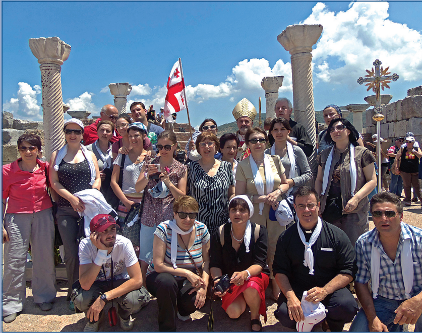
მომლოცველობა ეფესოსა და კაბადოკიაში