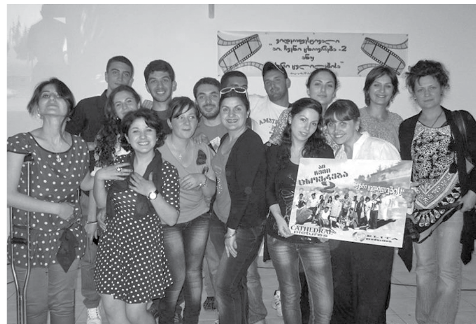
თბილისის კათედრალის ახალგაზრდები

ლონისძიება საკმაოდ დაძაბულ და ემოციურ ვითარებაში მიმდინარეობდა, ყველა სამრევლოს თავისებურად ლამაზად ჰქონდა დანახული და გადმოცემული მოცემული თემა. ეს შეხვედრა იყო ულამაზესი ნიშანი ჩვენი ეკლესიის ერთიანობისა და ახალგაზრდების ერთმანეთთან უფრო