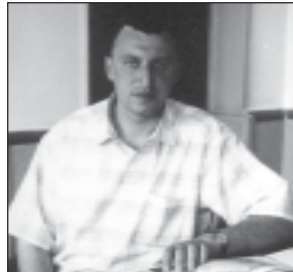
რაიონის რამდენიმე სკოლაში მხიფეა მრავალი რეკონსტრუქცია...