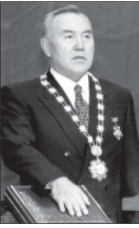
ჩვენს ქვეყნის პრეზიდენტი ნურსულთან ნაზარბაევი...