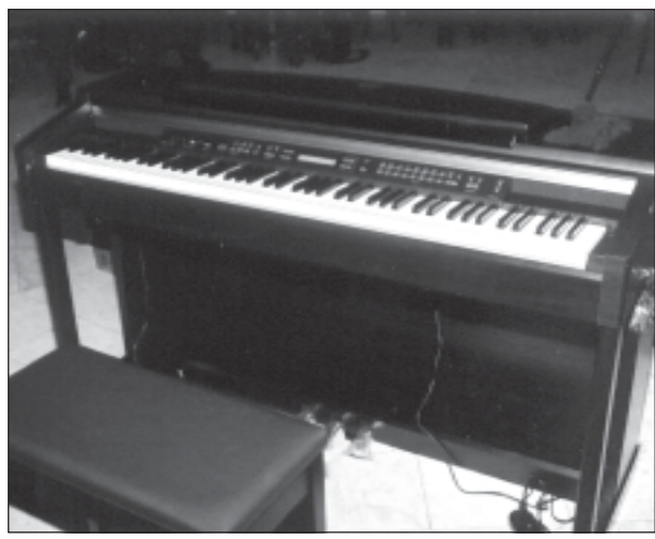
კონსერვატორიის სტუდენტებმა და-აპანიკეს პაინიონი - დაეკრეს რამდენიმე საწარმოები ორკესტრისა და ვოკალის თანხლებით.