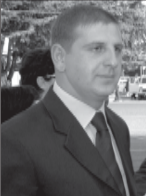
პრეზიდენტის სახელმწიფო რწმუნებული შილა ქართლის მხარეში