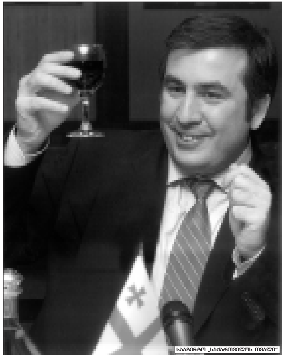
საბავანტო „საპარტიზმის თვალში“