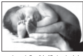
ორ კვირამი ამ სამშობიარო სახლებიდან 54 მოქალაქე შეემატა საქართველოს. ვილოცავთ! იმრავლოს სრულიად საქართველომ!