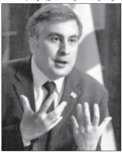
საქართველოს პარლამენტის წევრი...