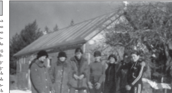
თუ დადასტურდა, თუ არა, ყველაფერი მანის ხომ აჭარლებს და სეანებს ბრძალდება...