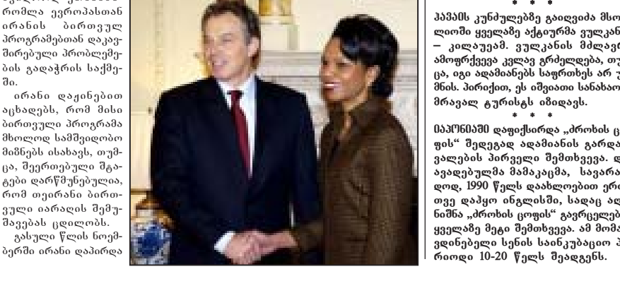
ამერიკის შერთავული შტაბის სახელმწიფო მდივანი ირანს აპრიტიკებს.