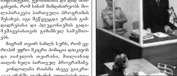
ამერიკის შერთავული შტაბის სახელმწიფო მდივანი ირანს აპრიტიკებს.

ამერიკის შერთავული შტაბის სახელმწიფო მდივანი ირანს აპრიტიკებს... საფრანგეთის, გერმანიისა და დიდ ბრიტანიის, რომ სახანაში მდებარეობს მოლაპარაკება ბირთვული პროგრამის შესახებ, იგი შეწყვეტა ურთიერთობის გადართობის და პლუტონიუმის გადართობის შესახებ.