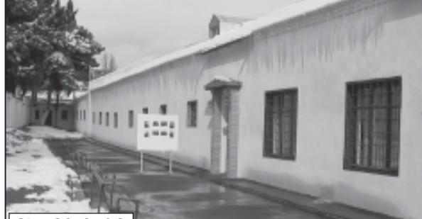
ნ. ბ. 80-2 83.

ქვემოთ ჩამოთვლილი სიაში მითითებულია უნივერსიტეტის სტუდენტების სახეობის რაოდენობა.