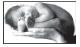
იხარა შეიღის მეძენით, მათ შორის მოიცავს უკვე გაქვარა, მოვიყვამლე მინ მშვიდობით დაბრუნდება.

მამალში, ქეთარაძის ქუჩაზე მდებარეობს მსს სამშობლო... (Text describes the birth of 15 children in a family.)