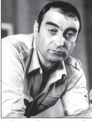
„ამ გულჯიბში ახლოთ გულთან...“

...და სტალინი... (Further commentary on the title's implications.)