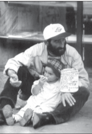
მეტი, მაგრამ რაღაც მაკავებს. მე მეგონი, თითონაც კარგად უყვია იმ სიმღერის ფასი - გოგონა იმიტომაც ჩამოხვედის ხოლმე პირუტყვს და რასაც შეითავაზებენ, უსიგველოდ იჯობს...

ჩერდა. ბიჭი წამოდგა და გახსულვლესიკენ გაემართა, რათა ახლა მეორე ვაგონში ეყვია ბუდი. ქალმა თვალი გააყოლა და თავი დანახებით გადააქინა. ეს ისეთი სურათი იყო, კაცს გულგრილი ვერ დარჩებოდა. დღე ერთი და მეტროს ვაგონებში ლუკმაპურის მაძიებელი - ათასი. ვინ გასაქოდავებელი, ვინ კი მარტინოვიჩის გონით ითხოვს დახმარებას. აგერ ეს ბიჭი, შემოსვლისთანავე მუხლებზე რომ დაეკა, და ვითომ სიმღერა შეიძახა, თითქმის ყოველდღე მხედდა. გუქსტყვ გაუპირებული აქვს: „ღეღეღო, ბიძებო, პურის ფული არა მაქვ, დედა არა მყავ, მამა არა მყავ, დამეხმარეთ!“ ის უცხო იყრის ჩაფრთხილებული ქალი ამ ხალხის შემოწირულობის იმედზეა. თი თუ სამი ბავშვი „გამარდა“, ახლა მთითვე თუ მესუთე აუტაგებია. ამაზრზენი ის არის, რომ ხმაში განსაკუთრებულ ინტონაციას აქვს, აქიოდა თქვენი სამოწილო არაფერი მჭირს, ვალდებულები ხართ და დამეხმარეთ!