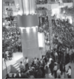
„სიბი-სპირსი“ სავაჭრო კომპლექსი ერთ-ერთი უდიდესია მოსოლიოში - იგი გაიხსნა ცათამბავნის სავაჭრო კომპლექსის დასრულების შემდეგ. 163 მაღალია განლაგებულია ცათამბავნის 4 სართული. ეს დაახლოებით 77 ათასი კვადრატული მეტრი სავაჭრო ფართობია.

მაღლივი შენობის აგება, რომლის შემუშავებაც ადამიანი უშეცდომოდ განსაზღვრავს, თუ რომელ ქვეყანაში იმყოფება და რომელი კულტურის გრადიენტით არის იგი აშენებული. ძველი დასაჯერებელია, მაგრამ არც ისე დიდი ხნის წინ, ქალაქის ამ ნაწილში, რომელსაც სინი პეკია, გლე-