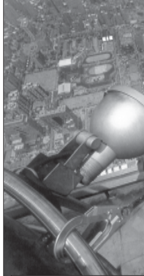
თამბარულებში სიმაღლეზე - 500 მეტრზე ამონტაჟებს ტექნიკის მძლავრ პროექტორს. მან სივრცე უნდა მისცეს თვითმფრინვებს გაივანის საბაჟო სივრცეში ფრენის დროს.

რათა დარწმუნებულიყენენ იმაში, რომ ცათამბავნის კომპი ცის ცირკულაციას არაფერი უშლიდა ხელს, პროექტის ავტორებმა კონსულტაციისთვის მიმართეს ფინურს საკუთარს გაივანელ ოსტაგს. მან განსაზღვრა