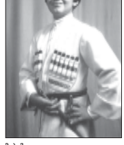
მთხეთის რაიონის სოფელ წილის საშუალო სკოლის მოსწავლეები...