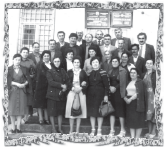
მთხეთის რაიონის სოფელ წილის საშუალო სკოლის მოსწავლეები სკოლის აღმშენებლის 25 წლისთავზე გასული 1983 წელს...