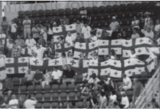
პირველი ღირსების ორდენით დაჯილდოების...