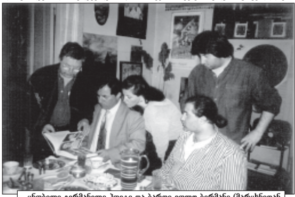
ცნობილი გერმანელი პოეტი და ბარდი ვოლფ ბარმანი (მარცხნიდან პირველი) ჯემალ აჯიაშვილს იკვამის.