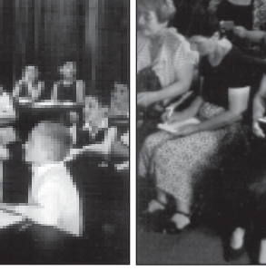
შალვა ამონაშვილი მუსიკოსებს უსმენს.