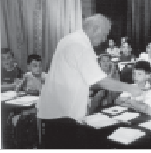
შალვა ამონაშვილი სემინარში მონაწილეებს მიმართულობს.