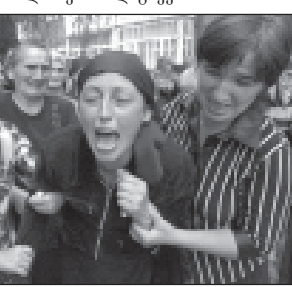
ბესლანის, ჩრდილოეთ ოსეთისა და რუსეთის სხვა რეგიონების...