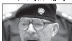
სადაც ჰუსინის მოადგილე