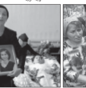
ბესლანის, ჩრდილოეთ ოსეთისა და რუსეთის სხვა რეგიონების...