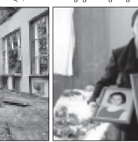
ბესლანის, ჩრდილოეთ ოსეთისა და რუსეთის სხვა რეგიონების...