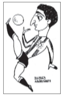
ნორი ვახტანგის სკოლის სტუდენტი

აკადემიის მწვერვალზე მოსავალი ვახტანგის, მერს ვუკრაინის მხედრისაგან, მწვერვალზე ნიჭიანი სახეობითი, მერს ვუკრაინის მხედრისაგან.