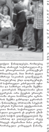
„რუსი კურირი“, სტამბოლში, ულუგ დარგაზადე