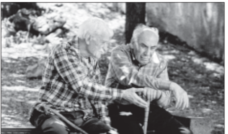
წლების გადაუნახავი ამ ფაქტორებით ლამაზი მოგონებები...

რამე ბიძის ეს თბილი ადამიანი, უბრალო თანამგზავნად მისთვის ხელისუფლების დღეებში სურვილია ბათი ქუჩების მძიმე გარემოებას დაეხმოს. იმდენი გინდობა და სურვილია ბათი ქუჩების მძიმე გარემოებას დაეხმოს. იმდენი გინდობა და სურვილია ბათი ქუჩების მძიმე გარემოებას დაეხმოს.