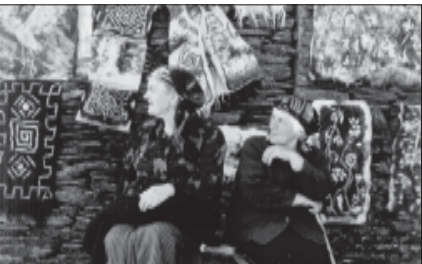
წლების გადაუნახავი ამ ფაქტორებით ლამაზი მოგონებები...