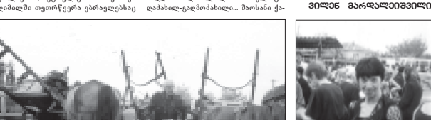
მისი სახელი უნდა იყოს... მისი სახელი უნდა იყოს...