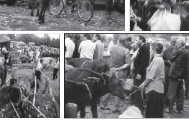
რეაქციის მიერ შეკავებული მასალები... მისი სახელი უნდა იყოს...