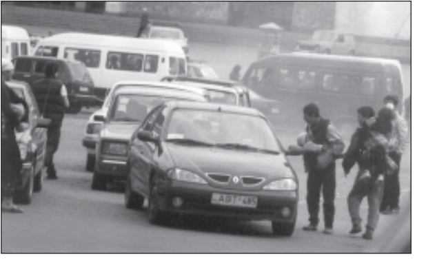
მანქანის შემოღობვით, თან ფანჯრის მინებს ჭკუკიანი ხელებით უპარკენებდნენ...

თბილისში მდებარეობს მძლოლი ბავშვების ტყვეობაში. მძლოლი ბავშვების ტყვეობაში.