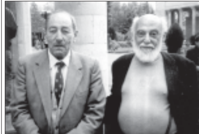
მთხრონიძის სახელმწიფო უნივერსიტეტში მუშაობა დასრულდა