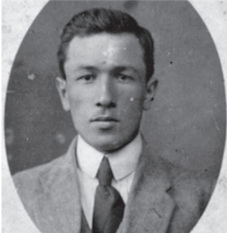
გოგიტა ფალავა, პოლიტიკური მოღვაწე, 1924 წლის აჯანყების ერთ-ერთი ხელმძღვანელი, საქართველოს დამოუკიდებელი კომიტეტის პირველი თავმჯდომარე

სალებზე დაყრდნობით ვარაუდობენ, რომ სოფელ ნახუნაოშიც (ბანძის მახლობლად) ფალავების სასახლე და ციხე-სიმაგრე ყოფილა" [გ. ელიავა. აბაშისა და გეგეჭკორის რაიონების ტოპონიმიკა.