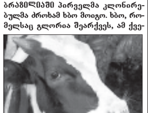
ანასის 12 სექტემბერს მოვედინა. „ახალმობლის“ წინა 38 კილოგრამს შეადგენდა, ახლა გლრილი დღემი საშუალოდ კილოგრამს იმარტებს. პარტეგევი მენსერების მეთავაყურობის ქვეშ იმყოფება.

ამომრეგა იმის თთობაზე, თუ როგორ შეიძლება ყოფილიყო ერაყის ყოფილი პრეზიდენტი თანამშრომლობა „ალ-ყაიდასთან“. პენეტრაციის მეთოდებზე აგრეთვე დასმინა, რომ არა აქვს ამის უტკავური მტკიცებულებები. რამდენიმე ასეთი კომენტარი წინასწარდებოდა ბუშის აღმინსტრაციის მიერ გეგმიურად დაგეგმილ განხილვებში. და ამჯერად თუ რამდენიმე თქვა ის, რასაც ფიქრობს, ეს ნიშნავს, რომ ბუშის აღმინსტრაცია თანდათანობით შორდება თავის წინანდელ პოზიციებს. როგორც ცნობილია, რამდენიმე წინათ აცხადებდა, რომ მქონდათ „ალ-ყაიდასა“ და სადამ ჰუსეინის შორის კავშირითარობის დადასტურებული უტკავური ინფორმაცია. ვიცი-პრეზიდენტი დაე ჩინი კი კიდევ უფრო შორს წავიდა, - იგი აღნიშნავდა, რომ ერაყის ყოფილი ლიდერი აძლევდა თავმჯდომარე გერონისგული ქსელის წევრებს, - იგი უნდა დაეგვიტევა, რომ ბრალდების ეს პუქტი იყო ერთ-ერთი მთავარი საბაბი, რომელიც ბუშის აღმინსტრაციამ გამოიყენა ერაყის პრეზიდენტის დაზოვებისთვის.