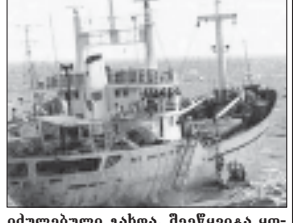
იმდენიმე მუხალდურებმა ჩინაღვს ნატოს წერტონის პრეზიდენტი. ჩინაღვლოგატეკური აღმინსტრაციის სახელმწიფო მადლიანი სარდლობა