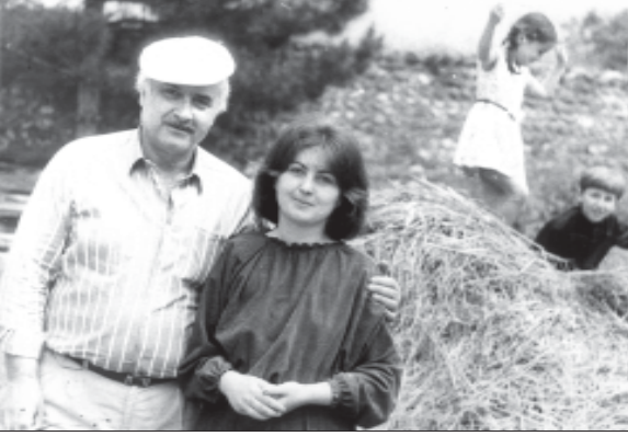
რამაზ მსაბაძე... ფოტოგრაფი...