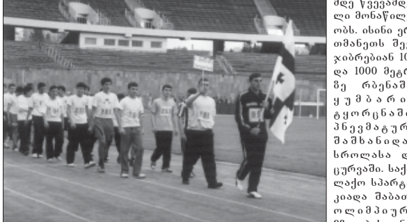
მდე წვევამდელი მონაწილეობის, ისინი ერთმანეთს შეჯიბრდებიან 100 და 1000 მეტრზე რბენაში, ყუ მ ს ბ რ ის კონკრეტული სპორტული სახეობების მონაწილეობის შედეგად დაჯილდოვდებიან.