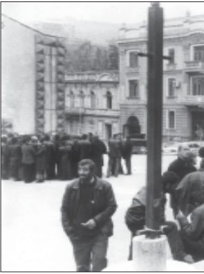
თი წვილის თანამართლები, მაგრამ რა შეუძლია ექსპერტისგან? დიდი არაფერი...