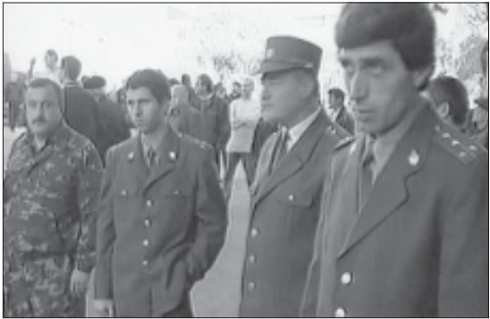
ჯამბის მორის გუნდის მდივანბარკეპე-დარ ხაბამ მინისტროს კანბენგის მენო-ბა სარწაროდ დგოგე. გუნდის საბამის სოსუფი, სამწუნადოდ, დაბირსიპირებაა პეს მიადწია...