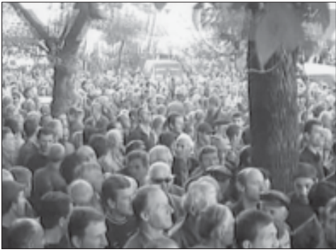
თქითბამოხლაპლაში აგხანეთის რესპუბლიკის პრეზიდენტის გამარჯვებული კანდიდატის, ოპოზიციის ლიდერის სერგეი ბაღაფუის მიმხრეებმა სოხუმში ყველა