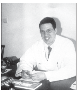
სონას სპეციალიზირებული რუსეთისა და გერმანიის წამყვანი ოფთალმოლოგიური ცენტრების აქტის გახილვა... სონას სპეციალიზირებული რუსეთისა და გერმანიის წამყვანი ოფთალმოლოგიური ცენტრების აქტის გახილვა...