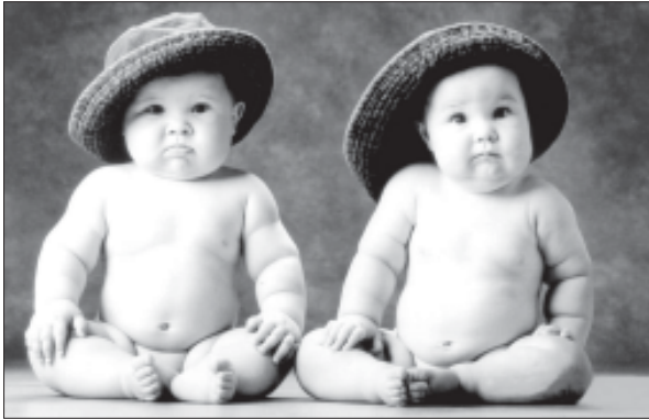
გუნის შესაძლებლობა თითქმის შეუძლებელია... გუნის შესაძლებლობა თითქმის შეუძლებელია...