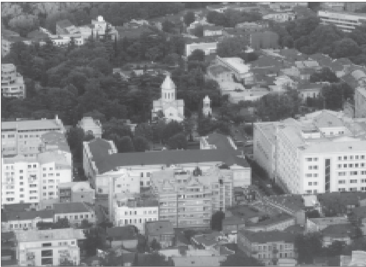
ღვთისმშობლის მიძინების მონასტრის მთავარ ეკლესიაში, ახალი სიციხე შეიქმნა. მაგრამ თბილისის მოქალაქეები კვლავ ამის შესახებ დღევანდელ ნომერში წაიკითხებენ.