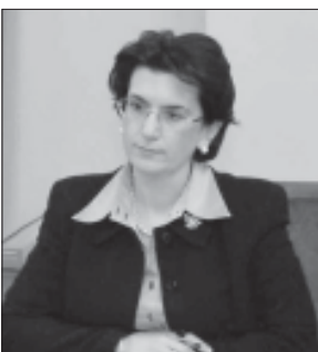
ალექსანდრე, რომ ქუთაისის ინტერესებს განხილავს. მისი განცხადებით, ქუთაისის საფინანსო სამსახურების გათვალისწინებით, ქალაქს ცენტრალური ბიუჯეტიდან 8 მლნ. ლარი სჭირდება. ნინო ბურჯანაძემ შეკრებილთ

გაზრდა სიხოვეს. ნინო ბურჯანაძემ, დედაქალაქის სოციალური პრობლემების განხილვისას აღუქვა და აღნიშნა, რომ ამ საკითხის მოგვარებაში აუხანაოების მინისტრთა საბჭოს თავმჯდომარეს ირაკლი ალასანიასაც ჩართავს. შემდეგ, ნინო ბურჯანაძე მუნიციპალიტეტის თავმჯდომარეებს შეხვდა. როგორც ითქვა, მრავალ სოციალურ პრობლემასთან ერთად, მათთვის მტკიცებულებები დაინტერესდა. ქუთაისის საფინანსო სამსახურების გათვალისწინებით, ქალაქს ცენტრალური ბიუჯეტიდან 8 მლნ. ლარი სჭირდება. ნინო ბურჯანაძემ შეკრებილთ