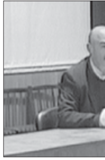
პროფესორ-მასწავლებლების თქმით, პროექტი ჩაღებული ნორმა, რომლის მიხედვითაც სწავლების უნდა უმაღლესი სასწავლებელი ირჩევს, საქართველოს სახელმწიფო უნდა საფრთხეს უქმნის.

ანის შესახებ გუშინ მათ საქართველოს პარლამენტის განათლების საკითხთა კომიტეტის სხდომაზე განაცხადეს, რომელზეც განათლების მინისტრმა კახალოშვილმა „უმაღლესი განათლების შესახებ“ კანონპროექტი წარადგინა.