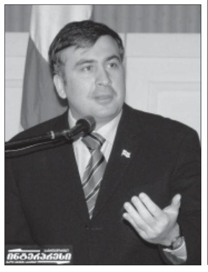
თავის სიტყვაში მიხეილ სააკაშვილმა, კერძოდ განაცხადა:

როგორც ვიხსენებ, 16 ნოემბერს საქართველოს პრეზიდენტი მიხეილ სააკაშვილი შეხვედა საქართველოს ტექნიკური უნივერსიტეტის პროფესორ-მასწავლებლებსა და სტუდენტებს. ქვეყნის პირველმა პირმა შეხვედრაზე ილაპარაკა განვლილი ათი თვის შედეგებზე და ხაზგასმით აღნიშნა, რომ მთავარი ამოცანა – ქვეყნის საიმედოდ შემობრუნება თითქმის შესრულებულია.