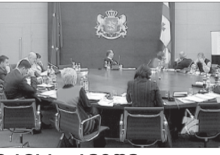
როგორც ვიხსენებ, 16 ნოემბერს საქართველოს ტექნიკური უნივერსიტეტის პროფესორ-მასწავლებლებსა და სტუდენტებს. ქვეყნის პირველმა პირმა შეხვედრაზე ილაპარაკა განვლილი ათი თვის შედეგებზე და ხაზგასმით აღნიშნა, რომ მთავარი ამოცანა – ქვეყნის საიმედოდ შემობრუნება თითქმის შესრულებულია.

საბჭოთაულმა უმაღლესმა სასწავლებლებს პროფესორ-მასწავლებლებს განცხადება, „უმაღლესი განათლების შესახებ“ კანონპროექტი სახელმწიფო უნდა საფრთხეს უქმნის.