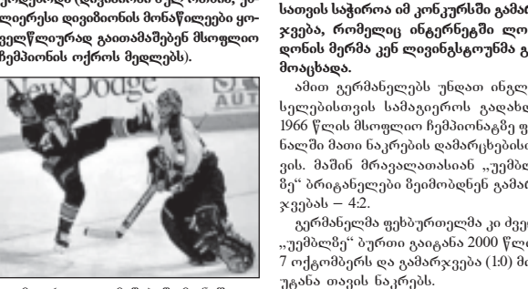
აშშ-ის სპორტული ორბიტაზე მრავალ სა- ხეობას მისდევს, მაგრამ პოპულარ-

პრეზიდენტმა ისე თქვა, რომ დღე- ქალაქში დაგეგმილია 300-მდე სპორტ-