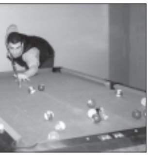
სურათში: ბილარდის ერთგული ფედერაციის ინიციატივით ჩვენმა მო-

სურათში: რუსეთის პრეზიდენტმა ვლადიმერ პუტინმა მიიღო სპორტის მემ-