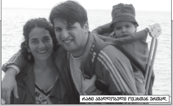
რამდენიმე საკითხი აქავე