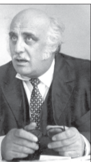
პრინს ადამიანები, რომლებიც თავიანთი საქმიანობით, მამუ-

ამ ფასეულობების გატანისთვის, ცხადია, არც დღევანდელი ჩვენი საზო-