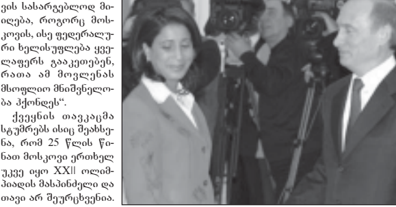
სურათში: რუსეთის პრეზიდენტმა ვლადიმერ პუტინმა მიიღო სპორტის მემ-