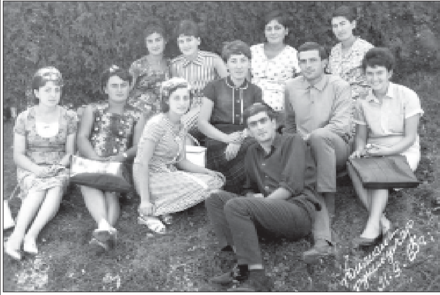
1965 წელს. მთავარმანქანის პლატო. თბილისის სახელმწიფო სამედიცინო ინსტიტუტის სამკურნალო ფაკულტეტის მე-4 კატეგორია.

შეგახსენებთ, რომ სურათების გამოქვეყნება უფასოა. ტელ: 99-66-10.