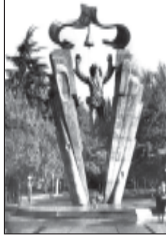
მეცნიერი სხდომა გამართა 1996 წლის 5 ივლისს.

1999, 2000 და 2001 წლებში თითო სხდომა ჩატარდა არაერთი (საბოლოო განმარტების) სამეცნიერო კონფერენციის შემდეგ.