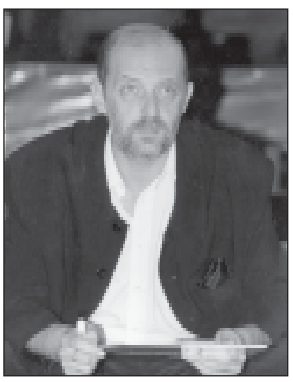
სამედიცინო ცენტრის - „გალას“ ადრენალინის დამამუშავებელი ფაბრიკის დირექტორი, რომელიც ფეხბურთის მწვრთნელის მუშაობის დაწყებისთანავე დაიწყო მისი მწვრთნელის მუშაობის დაწყებისთანავე...