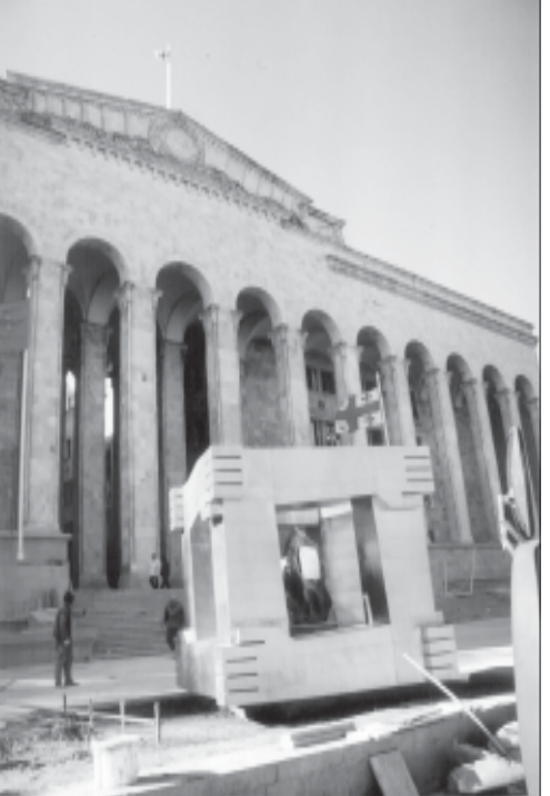
ნს. 80-2 83.