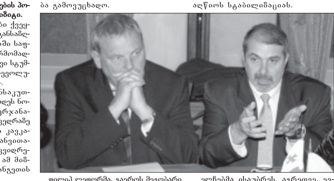
ფილიპ ლეფორმა, გაეროს მეგობარი ქვეყნის - საფრანგეთის - სახელით, აფხაზეთში მხარეებს მოლაპარაკების უწყობაში.

ქართული სამხედრო ასეულის მეთაური ნაწილი ურავიან საქართველოში გუშინ საღამოს დაბრუნდა.