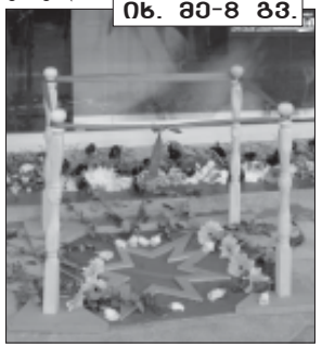
ნს. 80-2 83.

პირველი ქართველი კინოვარსკვლავი, XX საუკუნის საქართველოს სსრ-ის სიმბოლო, ურომლისოდანე წარმოუდგენელი ამ საუკუნის ქართული კულტურა, ნატო ვაჩნაძე გუშინ თბილისში დასრულდა.