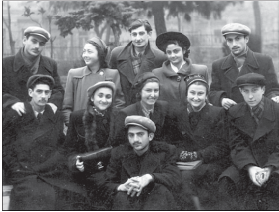
თბილისის სახელმწიფო უნივერსიტეტის მორეკრუსელების ერთი ჯგუფი. 1951 წელი. შოგაწაფა ბარამ ლორთქიფანიძემ. შეკასხვებთ, რომ სურათების გამოკვეთება უფასოა. ტელ: 99-66-10.