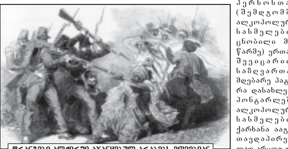
ფრანგული პოლიტიკის აკრძალვის პარაბის მონაცემები.

აბსენტი სიბრძნე ვარჯილი აბსენტის, ვაშლის (კერძოდ, ანისის ჯიშის), ბარბანის ნაყენია, რომლის სიმკვრივე 50-70 გრადუსია. აბსენტი შეიქმნება გავალით – მხამიან ნივთიერებებს, რომელიც აბსენტის გენში მოქმედებს იმავე რეცეპტორზე, რაზეც კამპანი და იწვევს პალეოსიციტების ამის გამო აბსენტის ითვლება თხევად ნარკოტიკად. აბსენტს მწვანე ფერს ქოროფილი აძლევს. წყალში გაზაფხებისას იგი რძის ფერს აღებლობს. ჭიქაში ამ სახმელს მურმუგის ფერი ამაკრავს.