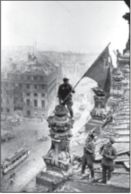
რატომ დაავალა სტალინი ბერძენის ოპერაციის განხორციელებას არა როგორცის ან კონიგს, არამედ მაინცდამაინც კუკოს? - ამ ოპერაციით სტალინი სურდა,

ჯერ კიდევ 23 აპრილს, გრუვენი ცდილობდა დაერწმუნებინა თავისი მრჩეველები იმაში, რომ იაპონიისთან მომავალი ომის დროს მათ არ დასჭირდებოდათ საბჭოთა კავშირის დახმარება, და ამიტომაც, საჭირო იყო ჯარი დაეხმათ ანტიკომუნისტურ კოალიციას. საბჭოეთში კავშირდროულად არ დაეთანხმებინათ მოსკოვს. იაპონელებს ხომ შეეძლოთ, ამერიკელთა წინააღმდეგ ჩინეთიდან გადმოეხურათ მილიონობით კვანტონის არმია, და ამერიკის შეერთებული შტატების დახმარებით ომში, მაშინ, ალბათ, ერთ ან ორ მილიონსაც კი გაუტოლებოდა. ვაშლინგტონისთვის ეს მიუღებელი იყო. თანაც, იმ დროისთვის ამერიკელებს ჯერ კიდევ არ ჰქონდათ გამოცდილი ბირთვული ბომბი. არც შეერთებული შტატების სამოხელეო ოპიონი შეერთებული შტატების დახმარებას ასეთი დალაგება. მაშინ ხომ ამერიკის მოქალაქეთა უმრავლესობა ნაზურუნობდა საბჭოთა კავშირს. ისინი ზედღედნენ, თუ რა დიდი სხეულს გაევიდოთ გერმანიამ და საერთო გამარჯვების მიხედვით. საბოლოო ანგარიშით, როგორც თვითმხილველები აღნიშნავენ, გრუვესმა უკან დაიხია და დათანხმდა ომის საბჭოეთთან დახმარების დასვენებას.