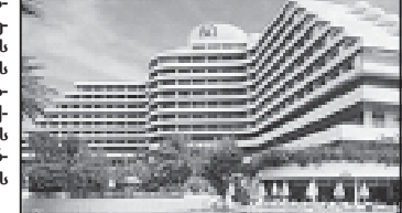
ბეჟინოში მიიღე დეკლარაცია ზაფხულის არდადეგების პერიოდის კენჭისყრაზე აგარებდა. ახლა მის იქაურ ფუნქციონერ საკურორტო ოკლეი არის აუტობი, ჩივი ბურთის მიიღება. „დამატებით“ ამ მოვარაკებს, ვინც მაიკლ დეკლარაციის სასკემოსს აირჩევს, შეიძლება პლაკეზე კმრინს შეტანილი ხილის შანსი მიეცეს. კიდევ ერთი მაგალითი „ვარსკვლავების“ ოკლეი: ბონომ და ეკმა (ჯგუფი „U2“ დუბლინიში მათ საკუთრებაში მყოფი სასკემოსის გაფართოების უფლება მიიღოვნ...

პოლიტიკაში ფრანგული ატოლი, ერთ დროს მარტონ ბრანდოს კუთვნილი, მისივე სახელის პერიკორტი გახლდა, რომელიც 2008 წელს გახსნება. პოლიტიკის ბევრი ვარსკვლავი ეწევა საოცლო ბიზნესს. როგორც დენი მონაწილეს ექსპარტულიანი მდიონერი ოკლეის მმენებლობაში (ამჟამად 2006 წელს). კალიფორნიაში, კარმელში მდებარე, სმელთაშუა მდის სკოლაში აგებული და დროის დეის კუთვნილი ოკლეი ასახავს მსახიობი ქალის საქმიანობის ცხოველობა დეისის სფეროში: აქ პარდაირ პორტიანთა შეილება საკუთის მიღება ძალღებისათვის.