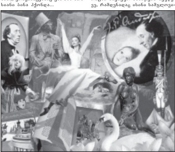
დიდი მეზღარის „დიდი სიყვარული“ დარჩა და დარჩა პლაგონური. ორ წელიწადს შეეფიქრა დაილოდა მომღერალ ქალი იფი ლინდანი (რომელსაც ბუბუბუს უწოდებდნენ მშენიერი ხმისათვის), ყველაფერს და ლექსებს არ აკლავდა, მაგრამ უარყვეს. სამაგიეროდ, ჩვენს მღაპარში გვევლინება უფროსი მღაპარი ნახევარ მილიონი და ფრანკული... არც ერთი მილიონის მონაწილენი იქნებიან. ის როლი ერიდებოდა ნორჩების ფსიქიკის გრამირებას, ბენდიერი დასასრულის მოძულე გახლდა. დავეციგო კიდევ ნაღვლიანი, მინაღამო პირქუში მღაპრები. ერთადერთი ნაწარმოები, რომელიც მას ბულვარ ვეხავდა - „ფერია“ იყო. არც ერთი მილიონის მონაწილენი იქნებიან.