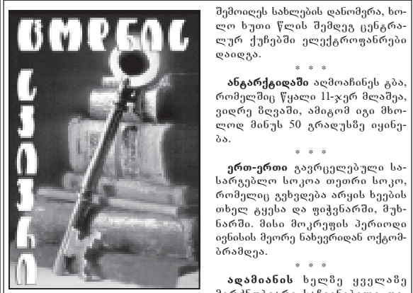
სამაშინს წვენი ძილისმოგვრელი ნარკოტიკია, იწვევს თავბრუსხვევას, ძილს, რომელიც ხშირად სიკვდილით მთავრდება. 1892 წელს თბილისში პირველად

შეშობის სახლების დანერგვა, ხოლო ხუთი წლის შემდეგ ცენტრალურ ქუჩებში ელექტროფანტები დაიდგა. ანტარქტიკაში აღმოჩინეს გზა, რომელშიც წყალი 11-ჯერ მდამაყვინდრდა, ამიგონ იგი მხოლოდ მინუს 50 გრადუსზე იყინება.