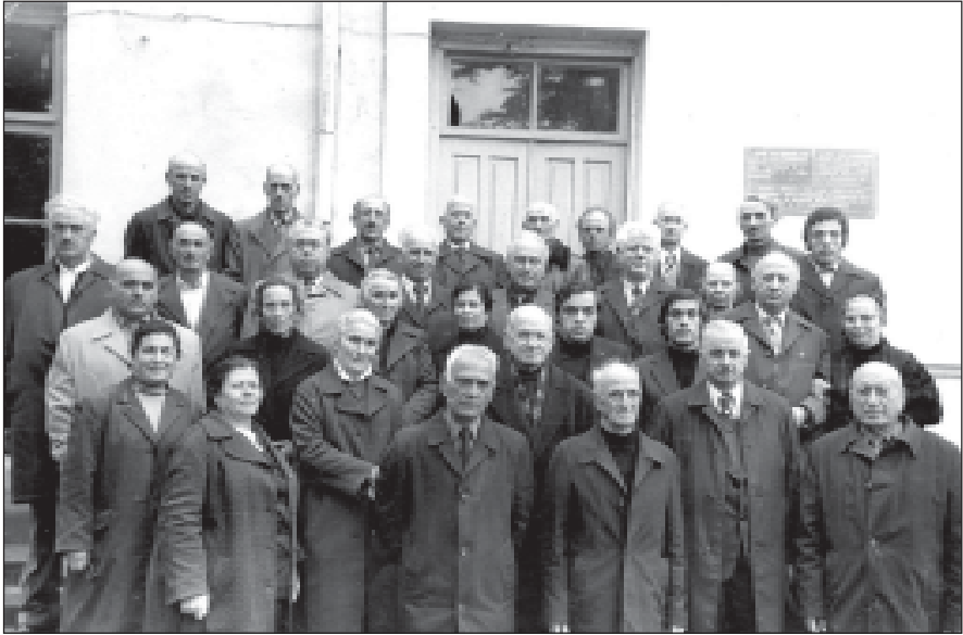
ქალაქ გალის № 1 საშუალო სკოლის (მემდგომში შოთა რუსთაველის სახელობის) მასწავლებლები და აღმწარმომადგენელი ერთი ჯგუფი სკოლის დამფუძნებლის 30 წლის იუბილეზე.

ფოტო გადაღებულია 1969 წელს.