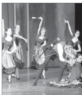
... „ღონ კობოტი“, როგორც ცნობილია, პრობოთად ეწოდა ამ ბალეტს, იგი თვითონ ბოლომდე, აღსანიშნავად უნდა აღვნიშნავთ, რომ სრულიად ახალი საბალეტო დასი, ისევე როგორც თეატრი, გაქრობის პირას მიყვანეს. ამასობაში, უკვე მოქცევავენად ჩამოყალიბებულ, მაგრამ უკვე სპექტაკლით დარწმუნებული ახალგაზრდები, სამიოდე ფანტის გამოკლებით, მიმოვიხილავთ.

მინამსს ბალეტი „ღონ კობოტი“, ბათუმის ისტორიაში, პირველი წარმოდგენა სრული საბალეტო სპექტაკლისა, რომელიც მთლიანად ადგილობრივი ძალებით განხორციელდა. ამ შემდეგის პრემიერა გიორგობას შედგა, რაც დირსახსოვარია ჩვენს კულტურისათვის!