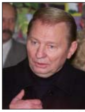
ქალაქობაზე, რადგან, ამ ქვეყანაში მოქალაქე...