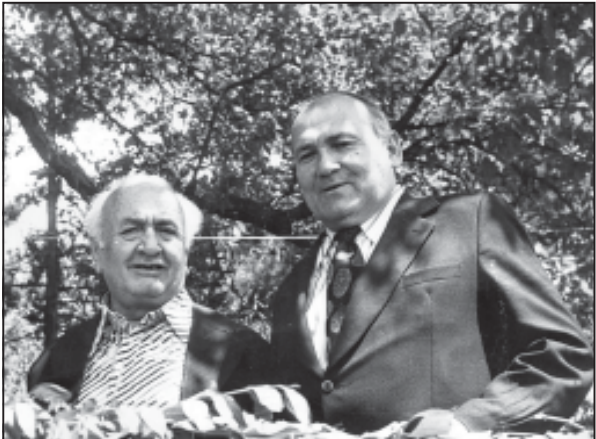
პარტიკალია ან სილოვან ნარიშკინი