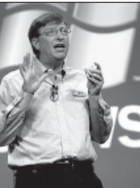
გაიბსა ხალხს ახალი Windows უჩვენა