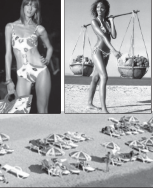
ნ. ბ-8 გ.

იურიდიკოსი საქართველოში დასაქვანაზე ოსებთან რუსეთის მოგვითი მსოფრთველი ინფორმაციის საშუალებით მიერ გავრცელებული ცნობების საწინააღმდეგოდ, უკრაინის პრეზიდენტი ვიტორ იუშჩენკო მინც აპირებს წესს ისარგებლოს ბაიზენების შევრებით. როგორც „უკრაინის კვირნიკის“ იგობინებულა, პრეზიდენტი პრესმდივანმა ირინა გერაშენკომ განაცხადა, რომ ეს მოსალოდნელია დაინტერესობა და ბევისტის დამდგომისთვის. ირინა გერაშენკოს თქმით, პრეზიდენტი ოცნებობს საქართველოში ჩასვლაზე. მაგრამ არ არის გამორიცხული, რომ იგი უკრაინის დარმს, ან კარაბებს. იუშჩენკო აპირებს შევრებაზე გააგრძლოს აქტიურად და ოჯახურ წრეში.