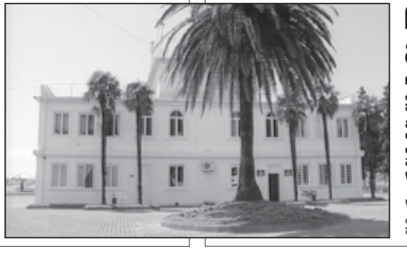
ნ. ბ-2 გ.