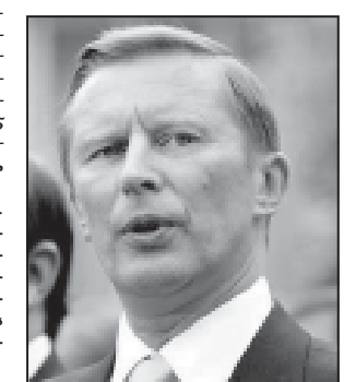
სერგეი ივანოვი რუსეთის ფედერაციის თავდაცვის მინისტრის თანამდებობაზე დაინიშნა. მთავრობის განცხადებით, მთავრობის განცხადებით, მთავრობის განცხადებით...