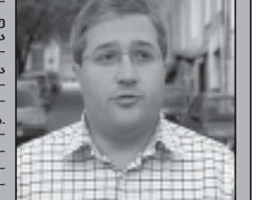
ივანოვი ფულზე ვაჭრობს. მთავრობის განცხადებით, მთავრობის განცხადებით, მთავრობის განცხადებით...