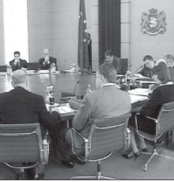
რობო კომისია შეიქმნება, რომელიც პრემიერ-მინისტრი უხელმძღვანელებს. გადამწყვეტილია მიღება განაპირობა კონსტიტუციის ვითარების შექმნამ მაღალმთიან რეგიონებში - რაჭა-ლეჩხუმში, მესტიამ, ქვემო სვანეთში, აჭარის მაღალმთიანეთში. მო-