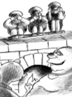
ნარაზრსა მუშაობაში - ისინი მუშაობენ ხელახლა...