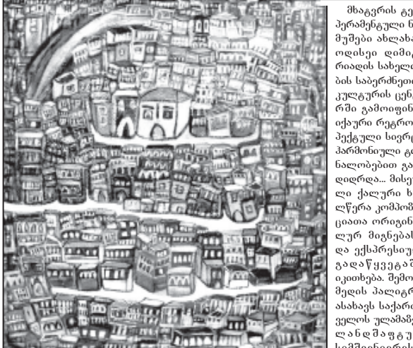
მზაკვრობის გემ-პრეზერტილი ნიჭები ახლახან ოდისეი დამიგრობის სახელოების საბერძნეთის კულტურის ცენტრში გამოფინა, იქაური რეგროს-პექტელი სივრცე პარმონული გონალობებით გამაღორდა... მისეული ხეღწერი კომპონიციათა ორიფინაღორ მინებება და ექსპრესიული გადაწყვეტაში იფინებება. შემოქმედის პალიტრა ასახავს საქართველოს კლამბეს და მშაგურ სიმშენიერეს...

მხბმარამ თავისი ფერწერული ნამუშევარი „ძველი თბილისი“ საქართველოში ყოფიხსას ამერიკის პრეზიდენტს უსახსოვრა ასეთი მოკრძალებული მინაწერი: „ბატონო პრეზიდენტო, თბილისური მთავრდელი უბები ყოველთვის გახსოვდეთ“. გავიდა დრო და... მუსტად ორი თვის შემდეგ, რუსუდან ხანთაძე-ანდრონიკაშვილი ვამინტრონიდან ჯორჯ ბუშის მადლიერებით სავსე წერილი მიიღო: „მშორშესო რუსუანი! მადლოვანი ვართ თქვენი მზაკვრობისათვის. მე ძალიან ვფასებ თქვენს გულითად ფესს და გულისხმებრებას. ღორა და მე გაგზავნით მოკითხვას საუკეთესო სურვილებით. პატივისცემით ჯორჯ ბუში“.