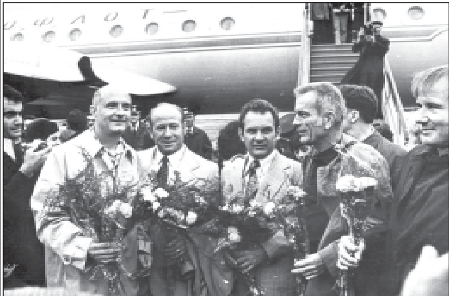
სსრკ-აშშ ერთობლივი კოსმოსური ფრენის „სოიუზ-აპოლონის“ ეკიპაჟის წევრები - მარცხნიდან: სტაფორდი, ლეონოვი, კუბასოვი, სლევინი, ბრანდტი თბილისის აეროპორტში. 1975 წლის 2 თებერვალი.