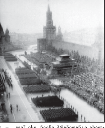
აპაი ბრეჟნევი, მედენი:

ჩვენი პრეზიდენტი მოსკოვში აუცილებლად უნდა ჩავიდეს. ამხელა შეიძლება, ამდენი ძვირფასი სკუმარი იქნება და მე რაგომ უნდა გამოაკლდეს? შეიძლება გამსახურდეს ვერ იქნება, - მოსკოვში ფეხს არ ჩავიდებ, ვიდრე ჩვენს დამოუკიდებლობას არ აღიარებენ, და... ცუდად შემოგვრიალა რუსეთში ეს დაქადება. რა ვიცი, ბუმი ჩაიღეს და სააკაშვილი არ ჩავიდეს, რადგან უხერხული მგონია.