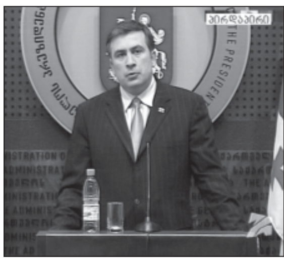
იხ. 30-2 გვ.

7 მაისს საქართველოს პრეზიდენტმა მიხეილ სააკაშვილმა სახელმწიფო კანცელარიაში გააკეთა საგანგებო განცხადება. ქვეყნის პირველმა პირმა, კერძოდ, აღნიშნა: „ბოლო თვეებისა და ბოლო კვირების განმავლობაში საგარეო საქმეთა მინისტრების დონეზე ჩვენ ვანარაღობდით ინტენსიურ მოლაპარაკებას საქართველოდან რუსეთის ბაზების გაქვანის თაობაზე. ჩვენ მიგვაჩინა, რომ ამ ბაზების ყოფნა საქართველოს ტერიტორიაზე არ შეესაბამება არც საქართველოს, არც რუსეთის ინტერესებს. ისინი ხელს არ უწყობენ ჩვენი ურთიერთობის გაუმჯობესებას. ჩვენ გვინდა საკითხის ცივილიზებული გადაწყვეტა. ჩვენ არ ვაპირებთ, რომ რაიმე სახის არაღიარებული ზემოქმედება განვახორციელოთ. გვინდა, რომ ცივილიზებულად, ეტაპობრივად, დიპლომატია და მოლაპარაკებების გზით, ყველა ადამიანის ინტერესების გათვალისწინებით მოხდეს ამ ბაზების საკითხის გადაწყვეტა საქართველოში.“