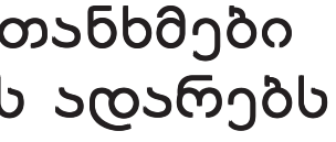
„კომსომოლსკაია პრავდა“, 7 მაისი.