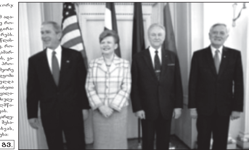
იხ. 30-2 გვ.

ამერიკის პრეზიდენტი ჯორჯ ბუში იწყებს ვიზიტს ლატვიაში, ლიტვაში და ესტონეთში. ამერიკის პრეზიდენტი 9 მაისს ბუში მოსკოვში მიიღებს მონაწილეობას გამარჯვების დღესასწაულში. ბუში იწყებს ვიზიტს ლატვიაში, ლიტვაში და ესტონეთში. ამერიკის პრეზიდენტი 9 მაისს ბუში მოსკოვში მიიღებს მონაწილეობას გამარჯვების დღესასწაულში. ბუში იწყებს ვიზიტს ლატვიაში, ლიტვაში და ესტონეთში. ამერიკის პრეზიდენტი 9 მაისს ბუში მოსკოვში მიიღებს მონაწილეობას გამარჯვების დღესასწაულში.