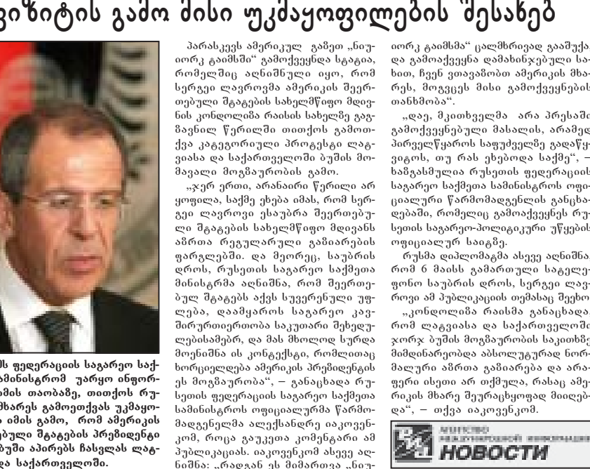
იხ. 30-3 გვ.

ორე გამოშმა“ ცალმხრივად გააშუქა, და გამოქვეყნდა დამინჯეული სახით, ჩვენ ვთავაზობთ ამერიკის მხარეს, მოგვეცეს მისი გამოქვეყნების თანხობა.“ „დაე, შეთხველმა არა პრესაში გამოქვეყნებული მასალის, არამედ ქვეყნის საგარეო უწყობის მხარეს, თუ რას უნებდა საქმე.“ - ხამგახმულია რუსეთის ფედერაციის საგარეო საქმეთა სამინისტროს ოფიციალური წარმომადგენლის განცხადებაში, რომელიც გამოქვეყნდა რუსეთის საგარეო-პოლიტიკური უწყობის ოფიციალურ საიტზე. რუსმა დიპლომატმა ასევე აღნიშნა, რომ 6 მაისს გამართულ საგარეო მინისტრთა აღნიშნა, რომ შეერთებულ შტატებს აქვს სუვერენული უფლება, დაამყაროს საგარეო კავშირების მართვა საკუთარი შეხედულებისამებრ, და მას მხოლოდ სურდა ლეზინისა ის კონტექსტი, რომელიც იხილეს ამერიკის პრეზიდენტის ეს მოგზაურობა.“ - განაცხადა რუსეთის საგარეო საქმეთა მინისტრის მოადგილე ვიქტორია სპირინა, რომელიც საგარეო უწყობის მინისტრის მოადგილეა ალექსანდრე იაკოვნიკოვ, როცა გაუკეთა კომენტარი ამ პუბლიკაციის. იაკოვნიკოვ ასევე აღნიშნა: „რადგან ეს მამართა „ნი-