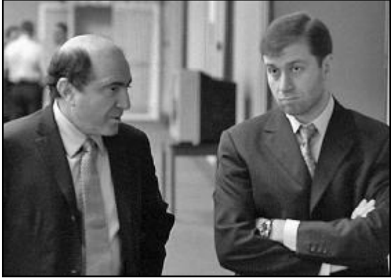
რომან აბრამოვიჩის ადვოკატი ინგლისის ისტორიაში სარეკორდო ჰონორარი - 7,8 მილიონი გირვანქა სტერლინგი, ანუ დაახლოებით 15 მილიონი დოლარი მიიღო.

ცოტა ხნის წინათ რუსეთიდან დევნილმა ოლიგარქმა ბორის ბერეზოვსკიმ რომან აბრამოვიჩს სასამართლოში უჩივლა იმის გამო, თითქოსდა 2000-იანი წლების დასაწყისში ამ უკანასკნელმა იგი აიძულა მთელი რიგი კომპანიის აქციები ღირებულებაზე დაბალ ფასად მიეყიდა, რის გამოც ბერეზოვსკიმ რამდენიმე მილიარდი დოლარი იზარალა. თუმცა, ლონდონის სასამართლომ ბერეზოვსკის არგუმენტები არ გაიზიარა, თანაც მდგომარეობა კიდევ უფრო დაამძიმა იმ გარემოებამ, რომ ასლა ბერეზოვსკის სასამართლო ხარჯის ანაზღაურებაც მოუწია, რის შედეგად, ანალიტიკოსთა განცხადებით, იგი საბოლოოდ გააკოტრდა. რაც შეეხება აბრამოვიჩის ადვოკატს ლორდ ჯონათან სამფუნსს, მისი ჰონორარი ინგლისის უზენაესი სასამართლოს 45 მოსამართლის ხელფასის ტოლია. ბერეზოვსკის ადვოკატს გაცილებით ნაკლები - „სულ“ 3 მილიონი დოლარი ერგო.