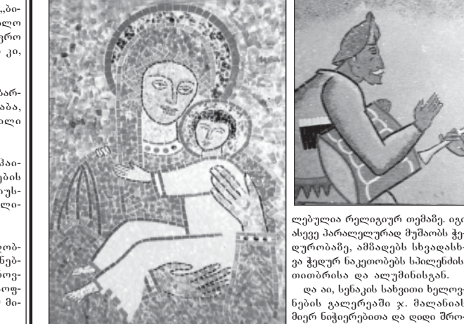
მალანია გაიბრწყინა სენაკში. მალანია გაიბრწყინა სენაკში.

საქართველოს ხელოვნების სახელმწიფო მუზეუმის სენაკის ფილიალის სახითი ხელოვნების გალერეაში გაიხსნა ჩხორიანის რაიონის მუზეუმის მხატვრობის გალერეა.