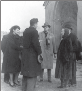
1948 წელს საქართველოს ენვია ფ. რუხველტის ფაქტი, რომელმაც თავის მამას მიუძღვნა საქვეყნოდ ცნობილი წიგნი „მისი თვალი“.