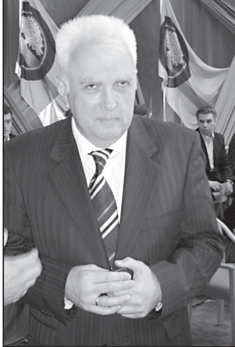
შალვა ოგბაიძე ხორციელდებოდა და ეს ჩანაწერი სოციალურ ქსელშიც დევს. არც ამაზე დაუკითხიხარ ვინმეს.

– რა თქმა უნდა. ათასობით ადამიანის მკვლელობის, ქონების წართმევის, წამების და უკანონო მოსმენების ფაქტი თუ იქნებოდა გამოძიებული, გაზულუნებული სასამართლო ასეთ გადაწყვეტილებას აღარ მიიღებდა. ფარული მოს-